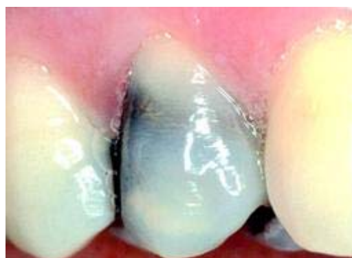
Verkleuring door grijze of zwarte vulling