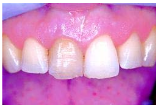
Verkleuring door een dode tand