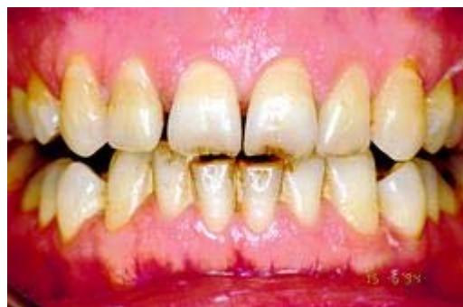
Verkleuring door verouderingsproces