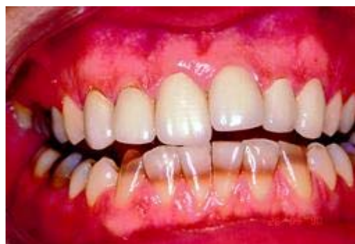
Verkleuring door ontwikkelingsstoornissen in de tandkiem

Klik hier voor meer informatie over bleken .