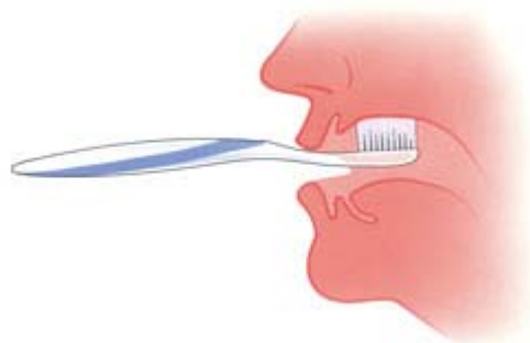
Maak ook uw gehemelte schoon