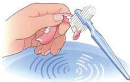
Reinig uw prothese na iedere maaltijd