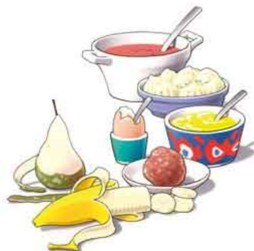
Begin de eerste dagen met zacht voedsel

Uw kunstgebit is nu nog nieuw en mooi. Dat wilt u natuurlijk graag zo houden. Daarom moet u, net als bij eigen tanden en kiezen, uw kunstgebit verzorgen. Als u het niet regelmatig schoonmaakt, blijven er voedselresten achter. Zowel op uw kunstgebit als eronder. Als u die niet verwijdert, kan uw tandvlees op den duur gaan ontsteken. Reinig uw gebit daarom zorgvuldig na iedere maaltijd. Gebruik een speciale protheseborstel, bijvoorbeeld van Lactona of Oral-B, en water om etensresten goed te verwijderen. Gebruik géén tandpasta. Die kan te veel schuren. Een schoon kunstgebit voelt altijd glad aan. Laat uw gladde gebit tijdens het reinigen niet uit uw handen glijpen. Het zal