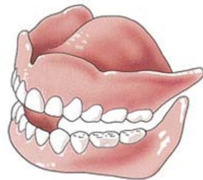
Tanden en kiezen zijn belangrijk voor het kauwen, spreken en het uiterlijk