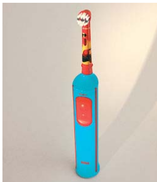
Elektrische tandenborstels voor kinderen hebben een speciale kleine borstelkop

Poets volgens de 3 B's: B innenkant, B uitenkant, B ovenop.