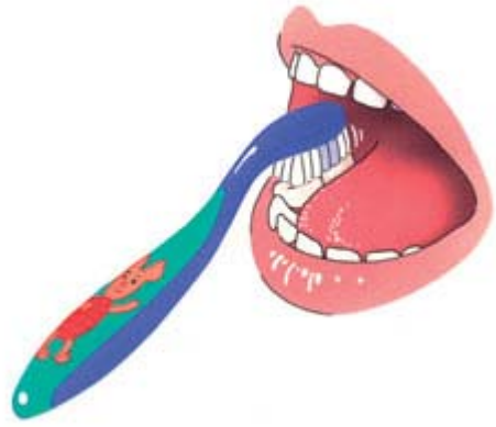
3. Poets hierna bovenop (de kauwvlakken van de kiezen)