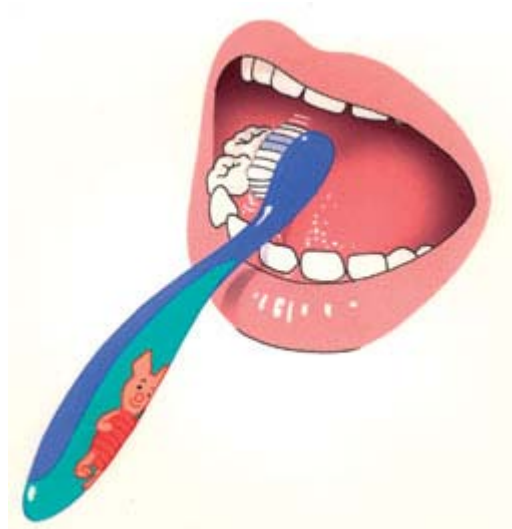
1. Begin beneden met de binnenkant.