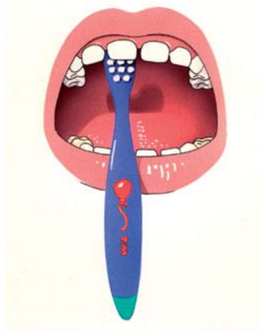
4. Poets vervolgens de boventanden en -kiezen. Poets eerst de binnenkant.