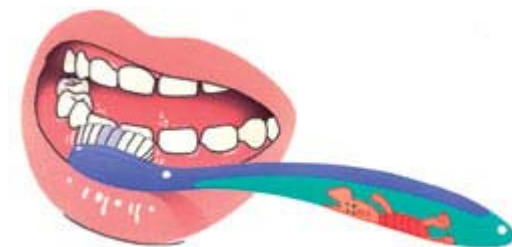
2. Dan de buitenkant