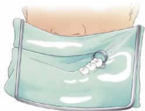
Soms komt er een heel dun rubber lapje in de mond

Soms spant de tandarts of mondhygiënist een heel dun rubber lapje om de hele kies of om meerdere kiezen. Dit wordt ook wel rubberdam genoemd. Een ringetje houdt het lapje op zijn plaats. Het ringetje drukt soms iets op het tandvlees, maar dat went meestal snel. Daarna spuit hij de kies met een luchtspuit droog.