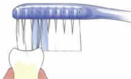
Tandenborstel komt wel bij het gesealde oppervlak