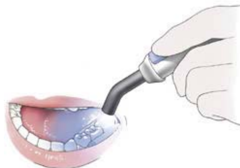
Verharden van de lak

Dan moet de lak hard worden gemaakt. Dat gebeurt met een lamp die blauw licht geeft. Soms gebruikt de tandarts of mondhygiënist een oranje schermpje om de ogen tegen het blauwe licht te beschermen. Tenslotte controleert de tandarts of mondhygiënist of de lak goed op zijn plaats zit.