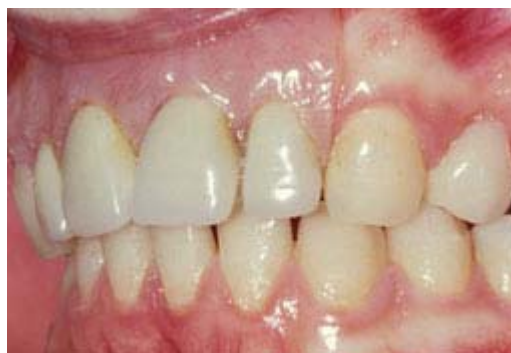
Plaatprothese van opzij