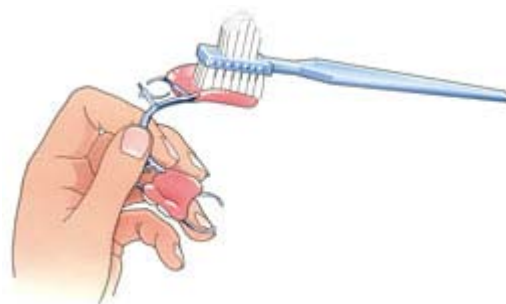
Reinig uw prothese na iedere maaltijd

Reinig uw kunstgebit dagelijks met een bij de drogisterij of apotheek beschikbaar reinigingsmiddel. Volg daarbij de voorschriften van de fabrikant. Vraag eventueel uw behandelaar of mondhygiënist om advies. Leg uw kunstgebit sowieso één keer per week een nachtje in een reinigingsmiddel. Hiermee voorkomt u de vorming van tandsteen op uw kunstgebit. Borstel uw kunstgebit daarna goed en