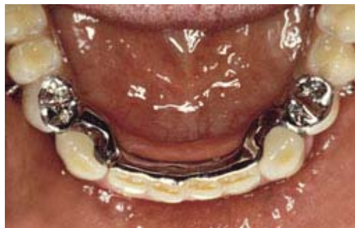
Frameprothese met verankering op kronen