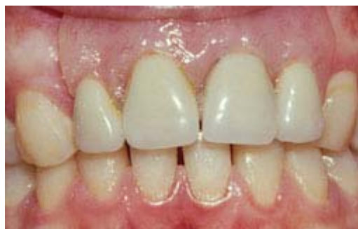
Plaatprothese van voren

De plaatprothese is gemaakt van een roze, tandvleeskleurige kunsthar. Daarin zijn de kunsttanden en kiezen verankerd. De gehele plaatprothese rust op het slijmvlies van de mond. Deze zit eventueel met ankertjes vast aan overgebleven tanden of kiezen.