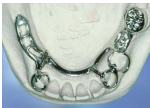
Frameprothese in wording op een gipsmodel, zonder kunsttanden en -kiezen

De frameprothese is gemaakt van metaal. Op het metaal is een tandvleeskleurige kunsthars aangebracht. Daarop zitten de kunsttanden of -kiezen. De frameprothese rust vooral op een deel van de overgebleven tanden of kiezen. Afhankelijk van het ontwerp rust de frameprothese ook meer of minder op het slijmvlies. De tandarts kan de frameprothese op twee manieren bevestigen. Of met metalen ankertjes die om enkele tanden of kiezen klemmen of met een soort slotje. Bij een slotje wordt de ene kant vastgemaakt aan een kroon, tand of kies en de andere kant zit vast aan de frameprothese. De frameprothese kunt u op die manier in het slotje schuiven. Het slotje zit doorgaans aan de binnenkant van de tanden en kiezen en is dus niet vanaf de buitenkant zichtbaar. Ankertjes zijn vaak wel enigszins zichtbaar.