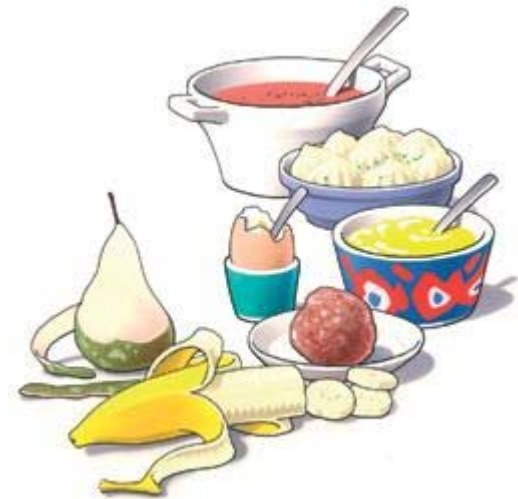
Begin de eerste dagen met zacht voedsel

Een tandprotheticus is een tandtechnicus die gespecialiseerd is in het maken van kunstgebitten.