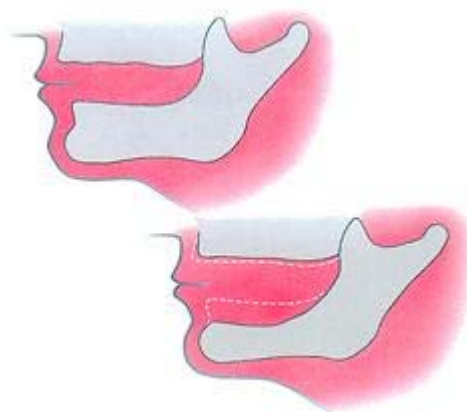
Het slinken van uw kaken gaat heel ongemerkt

Er zijn allerlei kleefpasta's, kleefpoeders en 'voeringen' op de markt om een kunstgebit meer houvast te geven. Die middelen zijn eigenlijk allemaal noodoplossingen. De oorzaak van het probleem wordt niet echt weggenomen. Doe nooit watjes onder uw kunstgebit. Uw kaken gaan daarvan alleen maar sneller slinken. Gaat uw kunstgebit loszitten? Ga dan naar uw behandelaar. Hij ziet meestal direct wat er aan de hand is en kan u het beste advies geven.