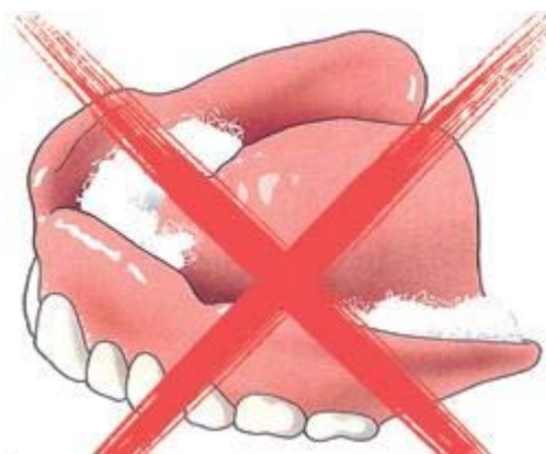
Knutsel nooit zelf aan uw kunstgebit, maar ga ermee naar uw behandelaar

Uw kunstgebit is nu nog nieuw en mooi. Dat wilt u natuurlijk graag zo houden. Daarom moet u, net als bij eigen tanden en kiezen, uw kunstgebit verzorgen. Als u het niet regelmatig schoonmaakt, blijven er voedselresten achter. Zowel op uw kunstgebit als eronder. Als u die niet verwijdert, kan uw tandvlees op den duur gaan ontsteken. Reinig uw gebit daarom zorgvuldig na iedere maaltijd. Gebruik een speciale protheseborstel, bijvoorbeeld van Lactona of Oral-B,