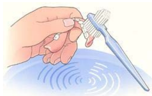
Reinig uw gebit na iedere maaltijd