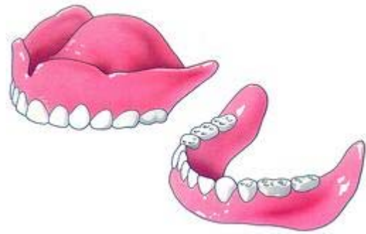
Tanden en kiezen zijn belangrijk voor het kauwen, het spreken en het uiterlijk