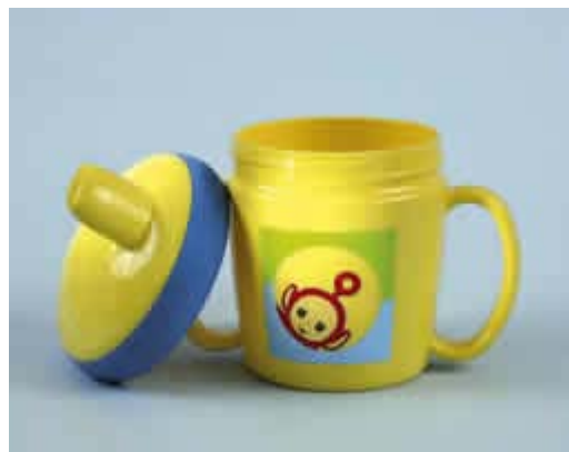
Laat uw kind vanaf 9 maanden uit een beker drinken

Maagzuur is extreem zuur. Zuren die in de mond komen tasten het tandglazuur aan. Deze vorm van onherstelbare gebitsslijtage wordt tanderosie genoemd. Sommige cliënten brengen de maaginhoud terug in de mond (rumineren of herkauwen) of hebben last van spontane terugkeer van voedsel (reflux). Bij reflux vloeit maagzuur terug in de slokdarm tot in de mondholte als gevolg van een storing van de sluitspier tussen de slokdarm en de maag.