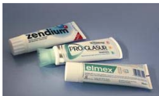
Gebruik een niet-schurende tandpasta