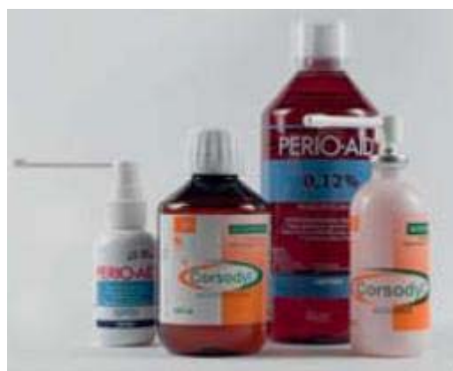
Spoelmiddelen en mondspray met chloorhexidine