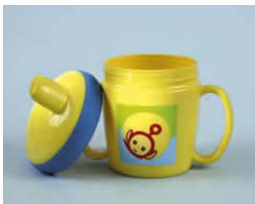
Laat uw kind vanaf 9 maanden uit een beker drinken

Vaak sabbelen aan een zuigflesje of anti-lekbeker met bijvoorbeeld vruchtensap, siroop, drinkyoghurt en andere melkproducten kan het gebit aantasten. Omdat het gebit langdurig met suikers in aanraking komt, is er een grote kans op het ontstaan van zogenoemde zuigflescariës. De kans hierop is kleiner als kinderen hun zoete drankjes in één keer opdrinken. Laat daarom uw kind vanaf negen maanden uit een beker zonder tuit drinken in plaats van uit een zuigflesje of anti-lekbeker. Gebruik een tuitbeker eventueel eerst als tussenstap. 's Avonds en 's nachts is het drinken uit een zuigflesje met zoete inhoud extra schadelijk. 's Nachts kan het speeksel de zuuraanvallen op het gebit vrijwel niet herstellen. Het ('s nachts) drinken van water uit een zuigflesje is overigens niet schadelijk.