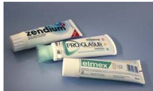
Gebruik een niet-schurende tandpasta

Poets ook met een elektrische tandenborstel uw tanden tweemaal per dag met een fluoridetandpasta.