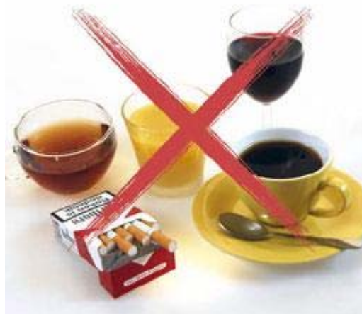
Tijdens de behandeling met de bleeklepel is het gebruik van deze producten af te raden

Door het bleken, wordt het glazuur van de tanden en kiezen iets poreuzer. Dat is tijdelijk. Het glazuur herstelt zich weer. Tijdens de behandeling met de bleeklepel kunnen bepaalde etenswaren en dranken het resultaat nadelig beïnvloeden. Voorbeelden daarvan zijn koffie, thee, rode wijn, koolzuurhoudende frisdranken, citrusvruchtensap en kleurstof bevattende etenswaren (zoals vruchtenjam). Tijdens de behandeling is het gebruik van deze producten, evenals roken, af te raden.