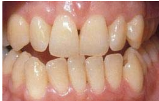
Voor het bleken