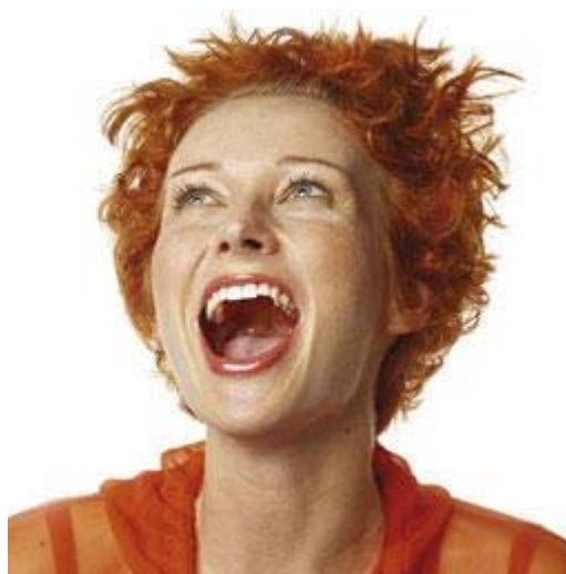
Het bleekresultaat verschilt voor iedereen

Het bleekresultaat verschilt voor iedereen. De basiskleur van uw tandbeen bepaalt voor een belangrijk deel het uiteindelijke resultaat. En die basiskleur is bij iedereen anders. Het bleekresultaat is soms niet blijvend. In een aantal gevallen komt de verkleuring na een paar jaar weer terug. De vorming van tandbeen gaat namelijk gewoon door. Ook gebleekte tanden zullen, net zoals niet-gebleekte tanden, op den duur verkleuren door veroudering. Dit proces gaat sneller als u rookt of bepaalde voedingsstoffen veel gebruikt. Het effect van langdurig of herhaald bleken op het tandweefsel is niet helemaal bekend.