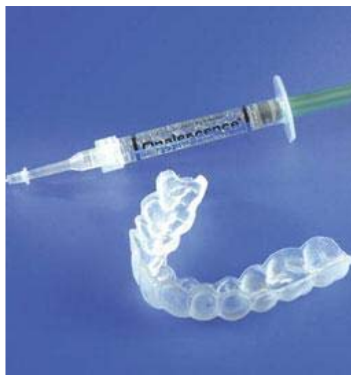
Van de tandarts of mondhygiënist krijgt u de doorzichtige bleeklepel en de gel met de blekende werking mee naar huis

Egale, niet te ernstige verkleuringen kunnen van buitenaf worden gebleekt. Dat gebeurt met behulp van een bleeklepel. Eerst maakt uw tandarts of mondhygiënist een afdruk van uw gebit. Hierop maakt de tandtechnicus in het tandtechnisch laboratorium een bleeklepel. Deze wordt gemaakt van een zachte kunststof, specifiek voor uw gebit. Dat is belangrijk, want dan past de lepel goed en wordt uw tandvlees goed beschermd tegen de blekende stof (peroxide). U krijgt de bleeklepel en de gel met de blekende werking mee naar huis. Daarom wordt dit ook wel 'thuisbleken' genoemd. Uw tandarts geeft aan hoe lang u de bleeklepel met de gel moet dragen voor het gewenste resultaat. Meestal zult u de bleeklepel 's