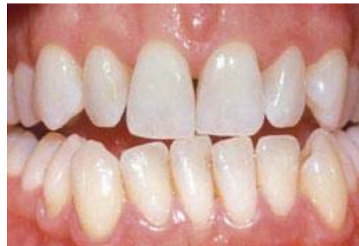
Resultaat na tien dagen bleken met de thuisbleekmethode onder begeleiding van de tandarts

De lengte van een bleekbehandeling hangt af van de bleekmethode. Bij de thuisbleekmethode duurt het meestal twee weken voordat u een gewenst resultaat bereikt.